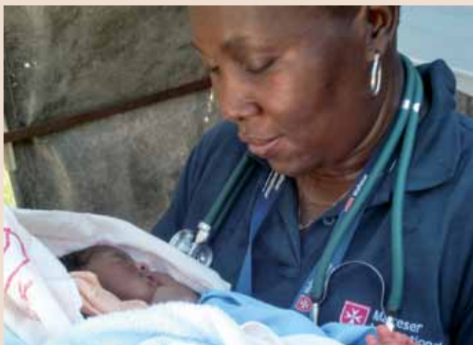
Lichtblicke: Die Malteser leisten Geburtshilfe