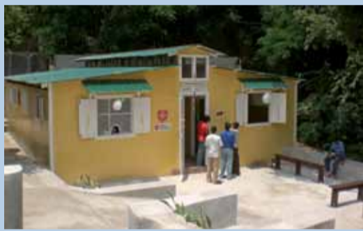
Wiederaufbau eines Gesundheitszentrums in Canapé Vert