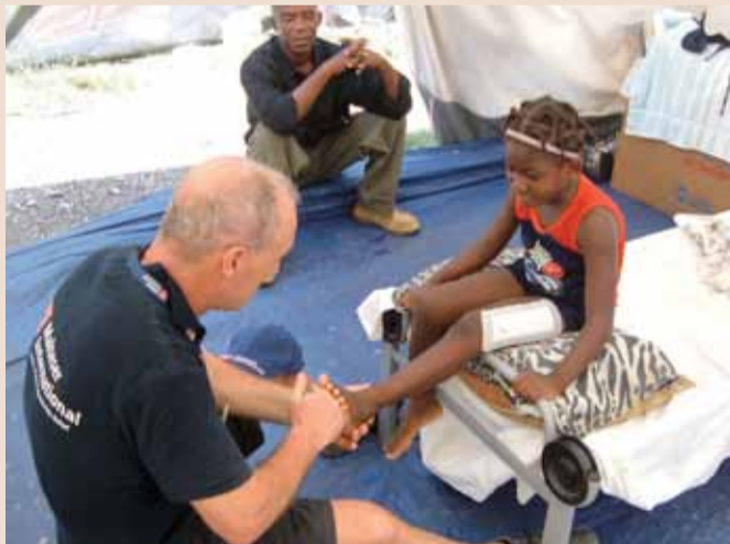
Medizinische Versorgung von Verletzten

„Danke, dass ihr nicht einen Moment gezögert habt, uns zur Hilfe zu kommen (...) und ihr dank Gottes Stärke viele Leben unserer Brüder und Schwestern gerettet habt.“