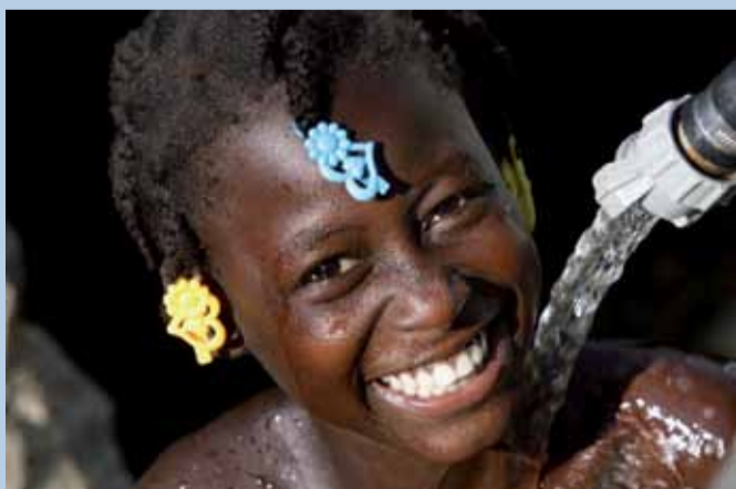
Wasser ist lebensnotwendig!

Haiti zählt schon vor dem Erdbeben zu den ärmsten Staaten der Welt und hatte bereits vor dem Erdbeben mit massiven Problemen zu kämpfen. Um den Menschen nachhaltig ein besseres Leben zu ermöglichen, engagieren sich die Malteser nicht nur in der Nothilfe, sondern unterstützen neben dem Wiederaufbau auch langfristige Entwicklungsinitiativen. Vorsorge ist dabei ein wesentlicher Bestandteil, denn sie kann Leben retten. Maßnahmen der Katastrophenvorsorge, besonders in den verwundbaren und armen Bevölkerungsgruppen, befähigen die Menschen, sich aus eigener Kraft zu helfen und in Zukunft besser geschützt zu sein.