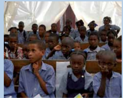
Schulunterricht in Zelten