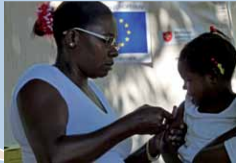
Impfkampagnen für Kinder