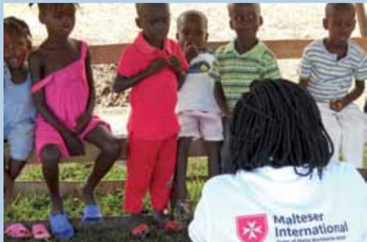
Gesundheits- und Hygieneaufklärung

„Capacity building“ ist wichtig, um das Gesundheitssystem nachhaltig zu verbessern. Daher fördert Malteser International die Ausbildung und Fort- oder Weiterbildung von Gemeindegesundheits Helfern und Hebammen in enger Abstimmung mit den lokalen Gesundheitsbehörden.